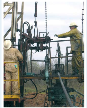
Här pågår renovering av en gammal brunn i östra Texas. Man ersätter alla gamla sönderrostade rör med nya friska rör.